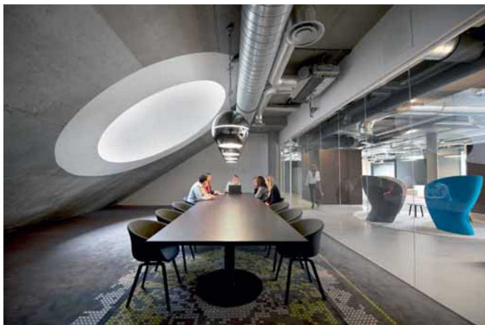
FOTO RECHTS De vergaderruimte met het ronde raam

Uitzendbureaus zijn sterk veranderd. De tijd dat werkzoekenden langs kwamen om vacatures achter het raam te bekijken of hun werkbriefje op vrijdagmiddag kwamen inleveren, is voorbij. Men komt op afspraak naar aanleiding van een vacature op het internet, het werkbriefje wordt online ingevuld. Ook bij Unique in Amsterdam – dat op zes verschillende locaties in de stad zat – was de aanloop sterk afgenomen. Besloten werd de vestigingen samen te voegen. Een A-locatie was niet meer nodig, wel een goede bereikbaarheid met verschillende vormen van verkeer – en dat biedt de nieuwe vestiging aan de Piet Heinkade. Alle intercedenten van de zes voormalige locaties werken nu hier, wat als bijkomend voordeel heeft dat alle specialismes van Unique in Amsterdam onder één dak zijn en de kennis kan worden gedeeld. Bovendien zijn hier alle bureaus weer bezet, waar er in de afzonderlijke vestigingen veel onbenut bleven. En door de samenvoeging kon er van de nieuwe