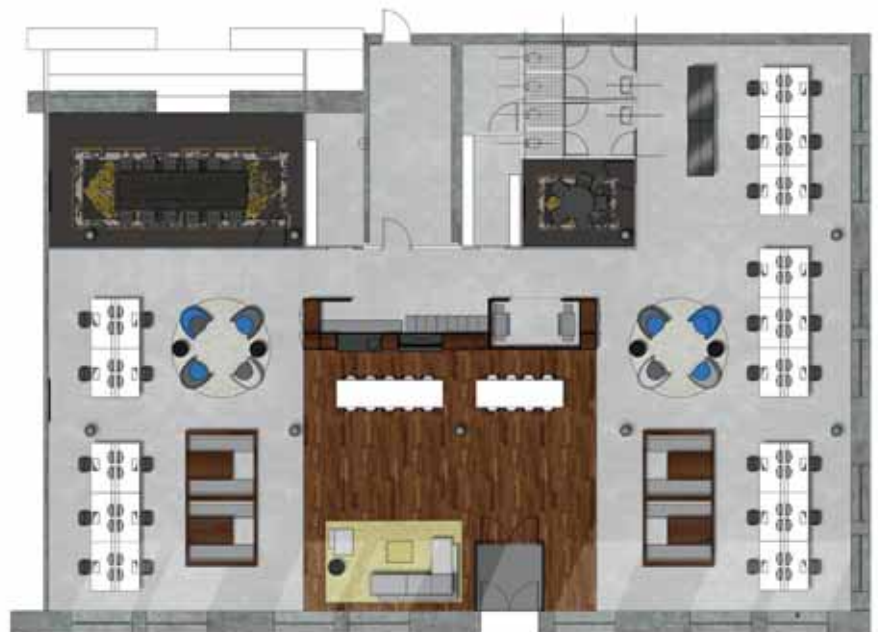
TEKENING ONDER Plattegrond