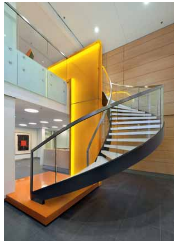
FOTO LINKS Het atrium