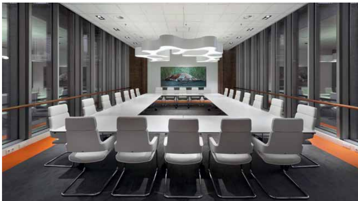
FOTO De boardroom