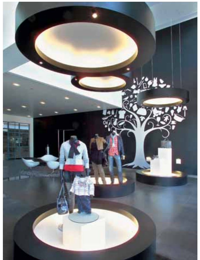
FOTO LINKS Het atrium. De indeling met karpotten en loungesets volgt de patroonvloer.

Interieurarchitectuur C4ID interieurarchitecten, Hilversum; projectarchitecten Geert Kok en Casper Schwarz Projectmanagement (turnkey inrichting) PVO Interieur, Hilversum Interieurbouw Van Assem interieurbouw, Utrecht Werkplek/vergadermeubilair Drentea; Bureau/vergaderstoelen Sedus (Open), Arper (Catifa), Dynamobel (Dis) Fauteuils Artifort (Lotus serie) Banken atrium Dedon (Zofa) Loggia meubilair B&B Italia (Canasta + Fat) Hoge lamp Cappellini (Big Shadow) Barkrukken Mobles 114 Barcelona (Flod), Plank (Miura) Poefs Baleri Italia (tato) Karpotten/matten Kymo (White&Black, Planet Rock), Paola Lenti Verlichting PVO Interieur, Hilversum Vloeren Anker Projectapijt, Armstrong Floor Products, Viva Vinyl Wanden & deuren Brakel Interieurgroep, Hilversum Ruimtescheiders Extremis (Sticks), Sunway (Parametre), Abstracta (Airflake) Bruto vloeroppervlak 11.500 m 2 Bouwsom € 5,0 miljoen